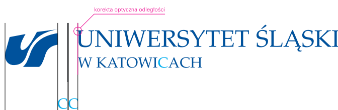
sygnet stylizowane litery „UŚ”