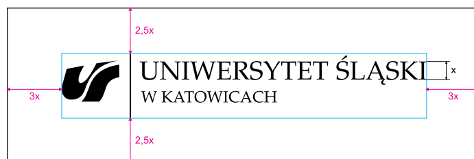
logotyp literne przedstawienie nazwy (krój pisma Palatino Linotype)